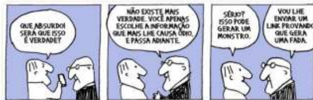
Figura 2: Tirinha publicada por André Dahmer em 11/10/18.

Dahmer na tirinha a seguir, a propósito do que se passava no período eleitoral em estudo: