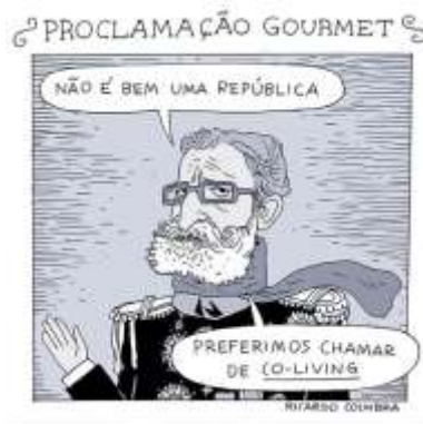
Figura 3: Charge publicada por Ricardo Coimbra em 18/11/18.

Mas a vida em sociedade exige encontros e confrontos e, sem um solo comum, sem o cultivo da ideia de que há um “comum” a ser cultivado, alimenta-se a confusão dos espíritos. Gostaríamos de encerrar estas reflexões com um dado do discurso humorístico, que só se pôr como resistência ao que se impõe tiranicamente no mundo vivido: