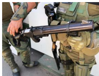
Un capitán de carabineros con un arma que lanza cartuchos de gas lacrimógeno. Al costado derecho carga una escopeta antidisturbios de perdigones.

Los carabineros también necesitan entrenamiento especial y una certificación anual para usar el arma antidisturbios de 37mm que lanza cartuchos de gas lacrimógeno. Se les indica que deben disparar hacia el cielo, para que la trayectoria del proyectil tenga un arco descendiente y caiga en el suelo detrás de la multitud, expresó un capitán de GOPE. No obstante, hubo señalamientos creíbles de que carabineros han disparado cartuchos de gases lacrimógenos directamente hacia los manifestantes, lo cual puede ser letal.