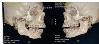
Imágenes de la mandíbula fracturada de Inda tomadas en el Hospital Carlos Van Buren en Valparaíso. 21 de noviembre de 2019.

También hubo varios casos de policías que embistieron a manifestantes con vehículos o motocicletas.