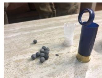
Un cartucho abierto y perdigones de 8 mm.

Sin embargo, los altos mandos de Carabineros no parecen haber transmitido ese riesgo a los agentes en la calle. Human Rights Watch entrevistó a tres carabineros que minimizaron el daño que podían provocar los perdigones. Un capitán expresó que es “muy difícil que un perdigón atravesara la ropa, incluso si [si se dispara] de muy cerca”, y un cabo señaló que era “imposible [que los perdigones causen] daño ocular grave”.