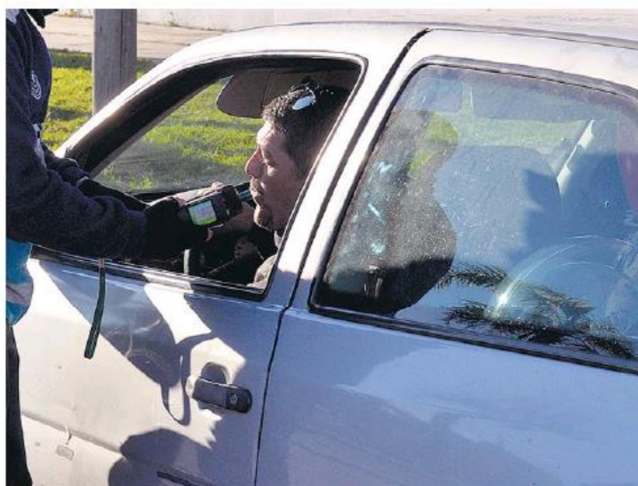
La eliminación del alcohol en sangre no es posible acelerarla.

Incluso en los distritos donde se sigue aceptando el límite de 0,5 para manejar, como en la ciudad de Buenos Aires, lo ideal es que a la hora de conducir el alcohol en sangre sea cero. Aunque los conductores no se den cuenta, su presencia les produce distintos síntomas, que pueden ser peligrosos en las calles. “Se altera la conciencia, produce disminución e inhibición de los