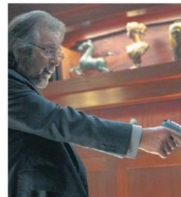
Al Pacino encabeza la producción de Jordan Peele.

El año es 1979. Un grupo de cazadores de nazis judíos tiene localizado a Adolf Hitler. ¿Dónde podría estar escondido el máximo villano del siglo XX? En la Argentina, por supuesto, disfrutando de su retiro junto a Eva Braun (Lena Olin). Así de provocador y sugestivo es el