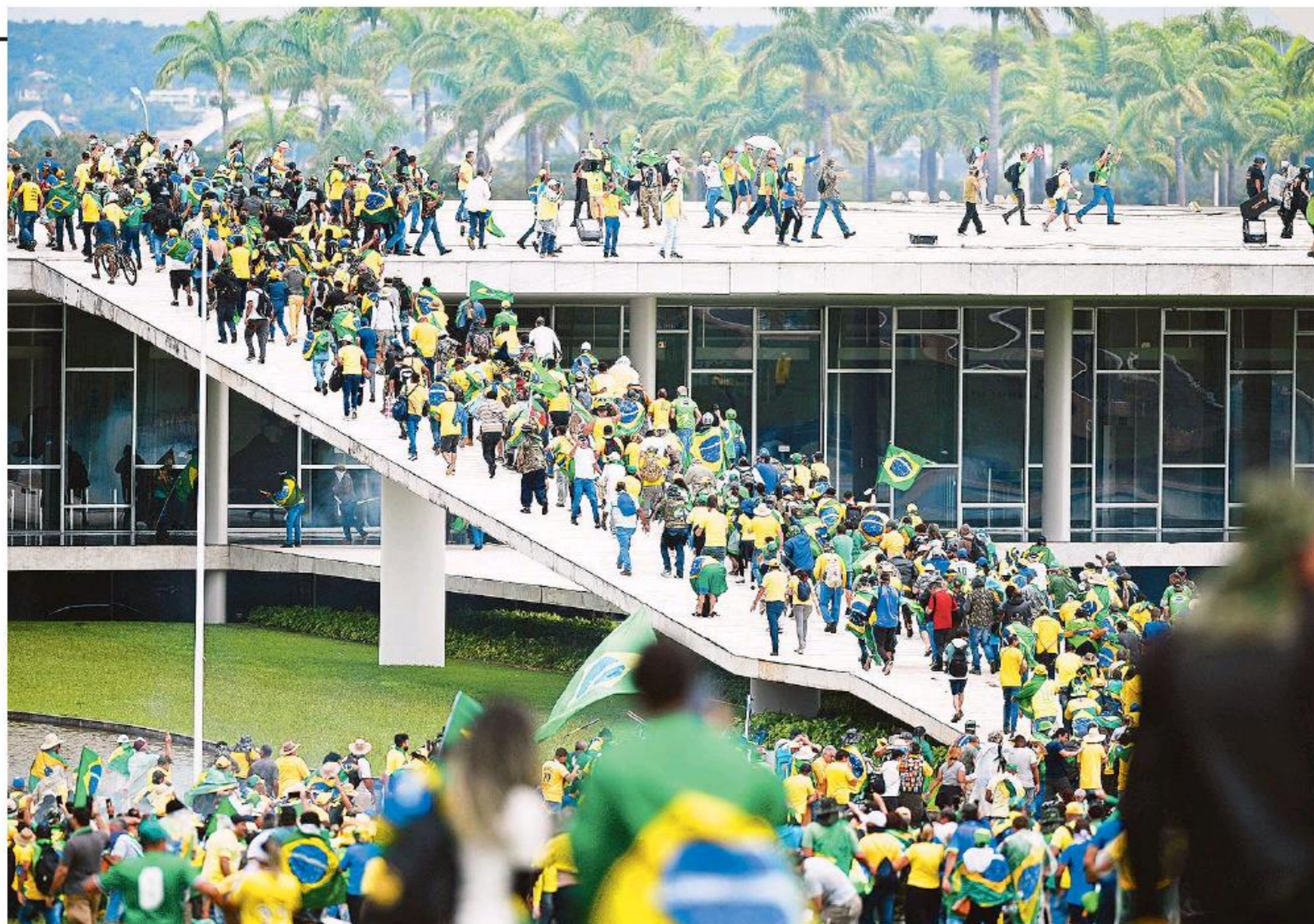
Una turba invadió y atacó las sedes del Congreso, el Planalto y la Corte Suprema.