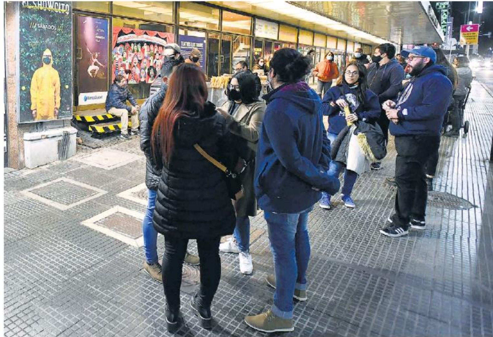
La comunidad audiovisual viene pidiendo desde hace varios años modificar la ley vigente, sancionada en 1994.

El texto de los noventa modificaba aquel promulgado en la década del '50: se erigió como modelo legislativo para otros países y constituyó uno de los elementos claves a la hora de posicionar a la