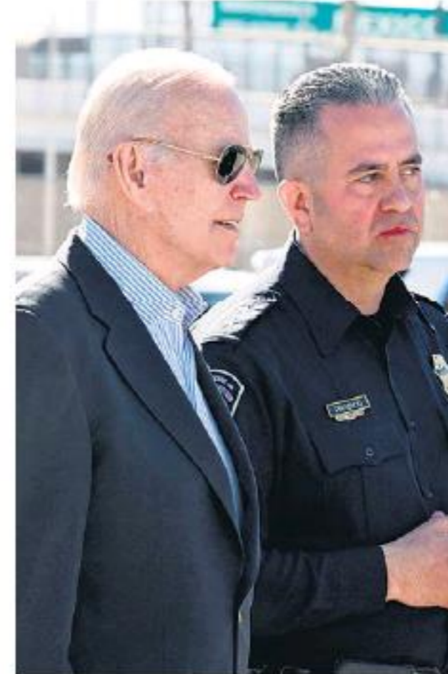
Biden en El Paso.

Biden se reunió con personal uniformado del Servicio de Aduanas e Inmigración en el puesto de control del Puente de las Américas, un complejo de edificios de inspección y vallas que separan a los dos países. Los agentes y oficiales, incluidos especialistas en perros rastreadores,