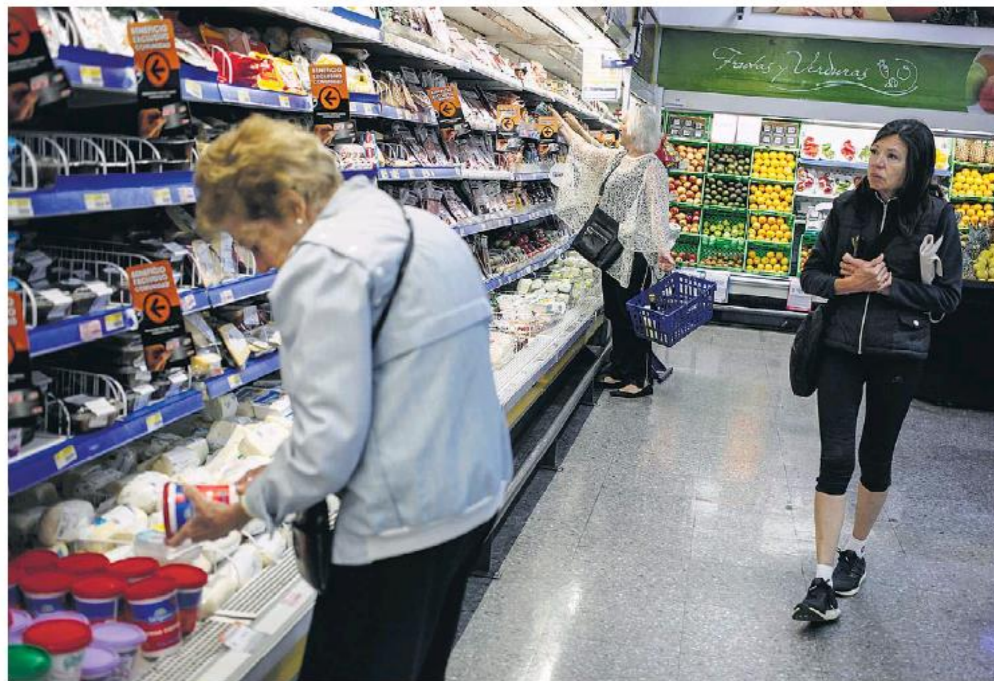
Los alimentos se desaceleraron en diciembre.

Los especialistas coinciden en que la estacionalidad es favorable en enero y febrero, pero el gran desafío será domar los precios en marzo. El contexto internacional mejora.