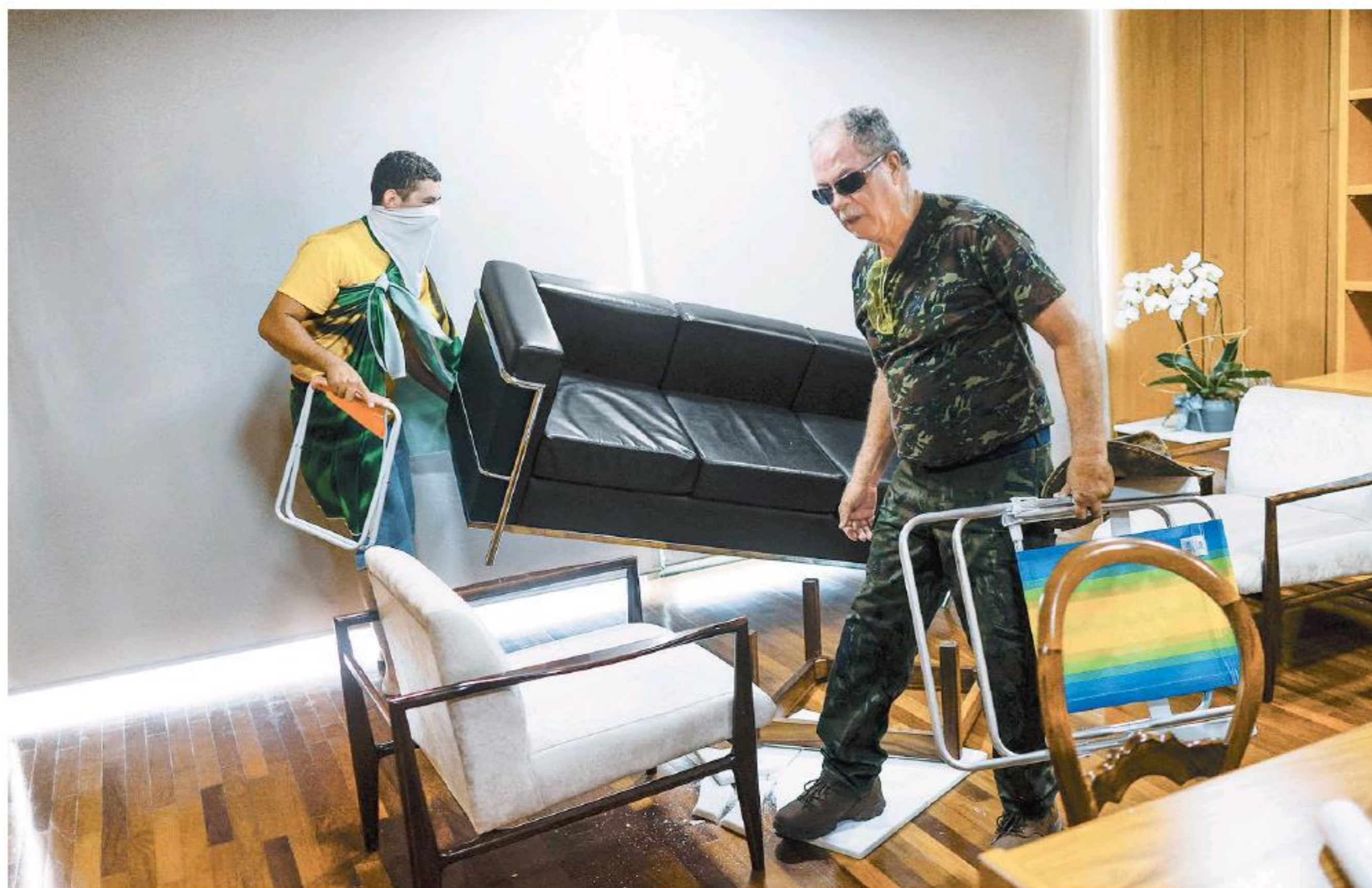
Los militantes de Bolsonaro justifican su invasión (y saqueo) al Estado en nombre de dios.

"Quienes no puedan ir a Brasilia deben ir a las alcaldías, ayuntamientos, sedes de los gobernadores de cada estado y deben entrar todos juntos. No entren en grupos pequeños para no ser atacados por