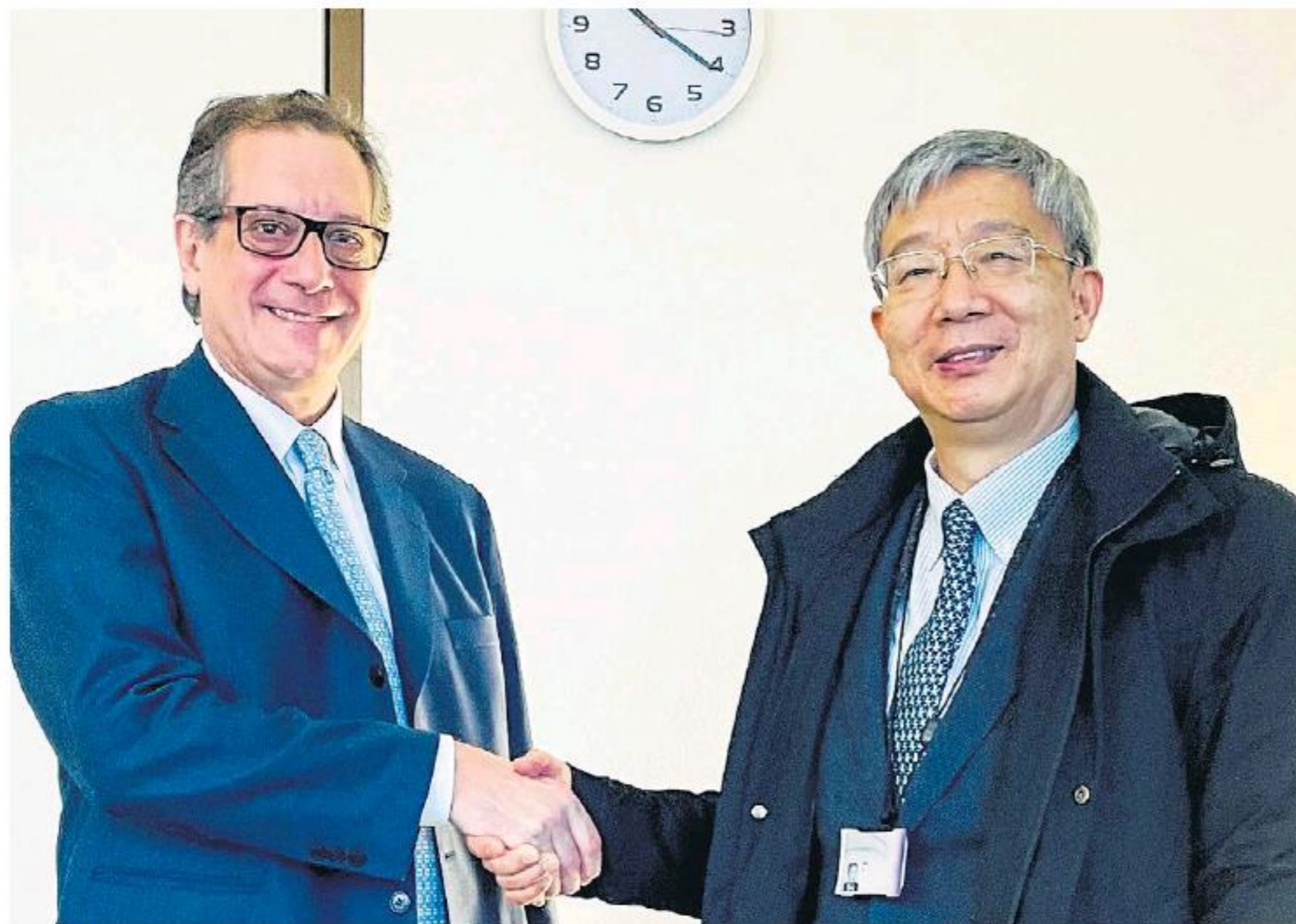
Miguel Pesce junto al gobernador del Banco de la República Popular China, Yi Gang.

El acuerdo se había confirmado en la última cumbre del G20 y se puso en marcha ahora. Sirve para fortalecer las reservas internacionales de la autoridad monetaria.