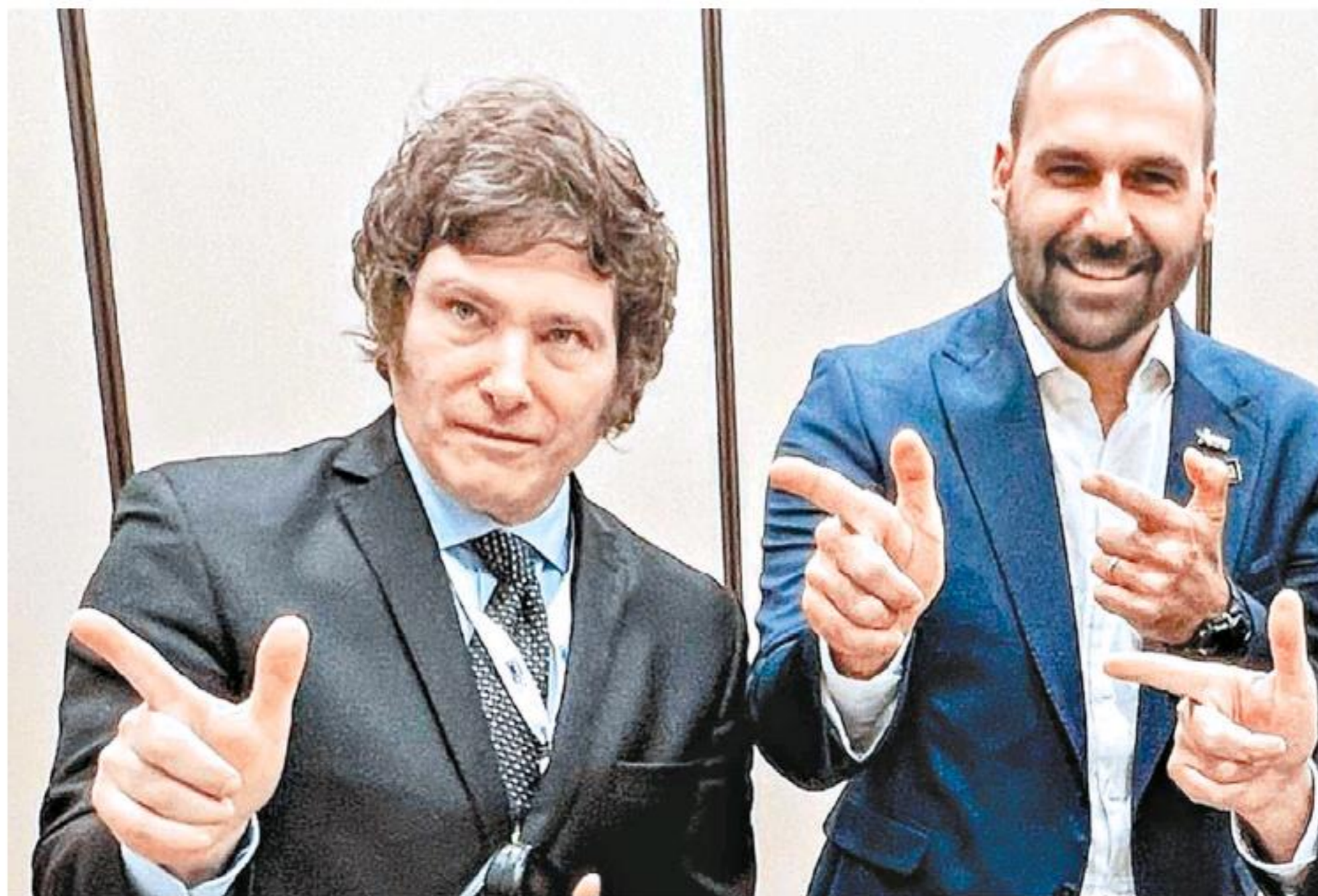
Milei siempre buscó ser un aliado de Jair Bolsonaro.

Con una fake news se hizo eco de trolls al repostear una publicación que describió al ataque como “una masiva protesta”.