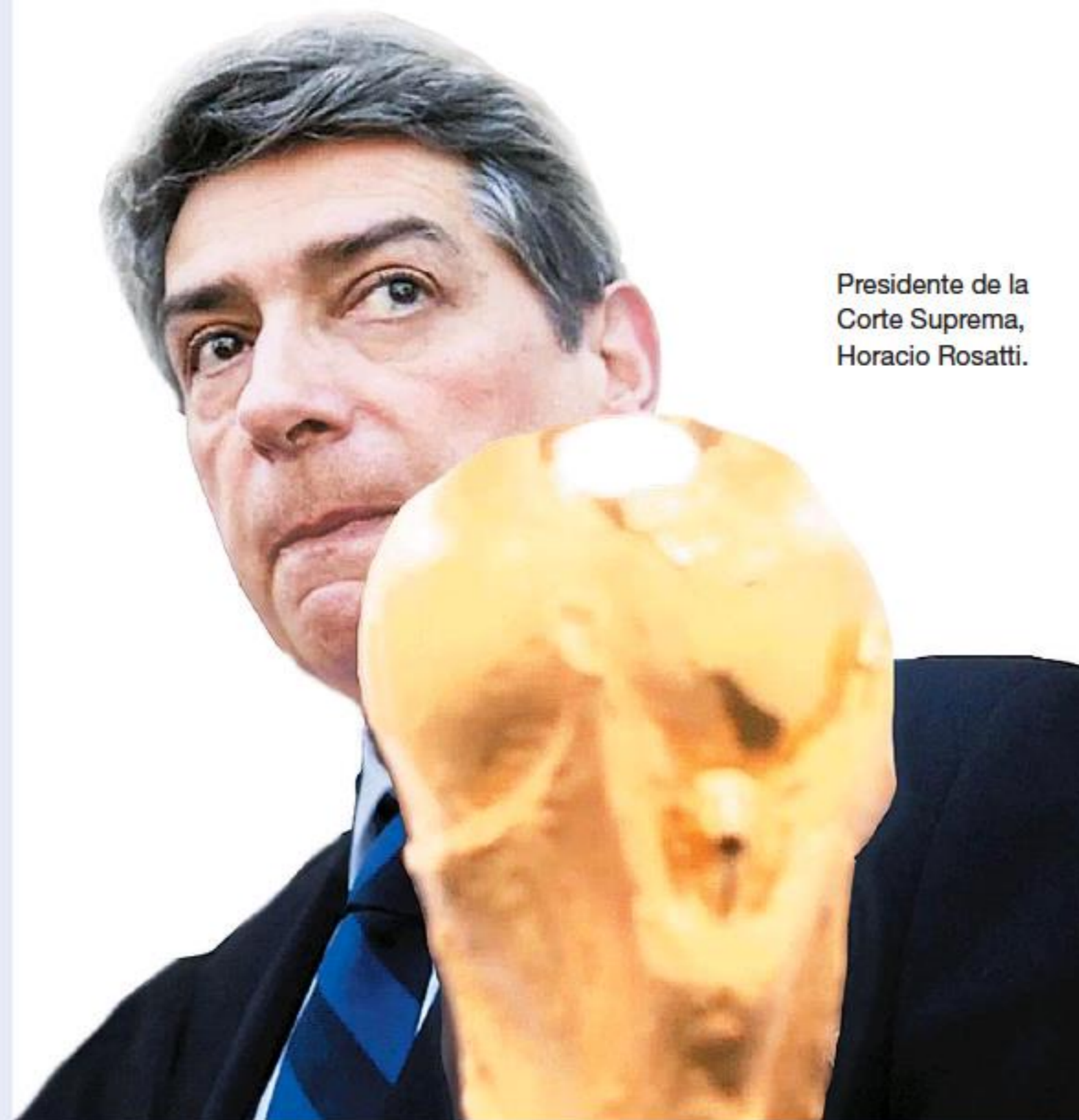
Presidente de la Corte Suprema, Horacio Rosatti.

un Consejo de la Magistratura bloqueado por la intervención de la propia Corte Suprema, al Gobierno solo le queda enfrentar la situación con jugadas testimoniales.