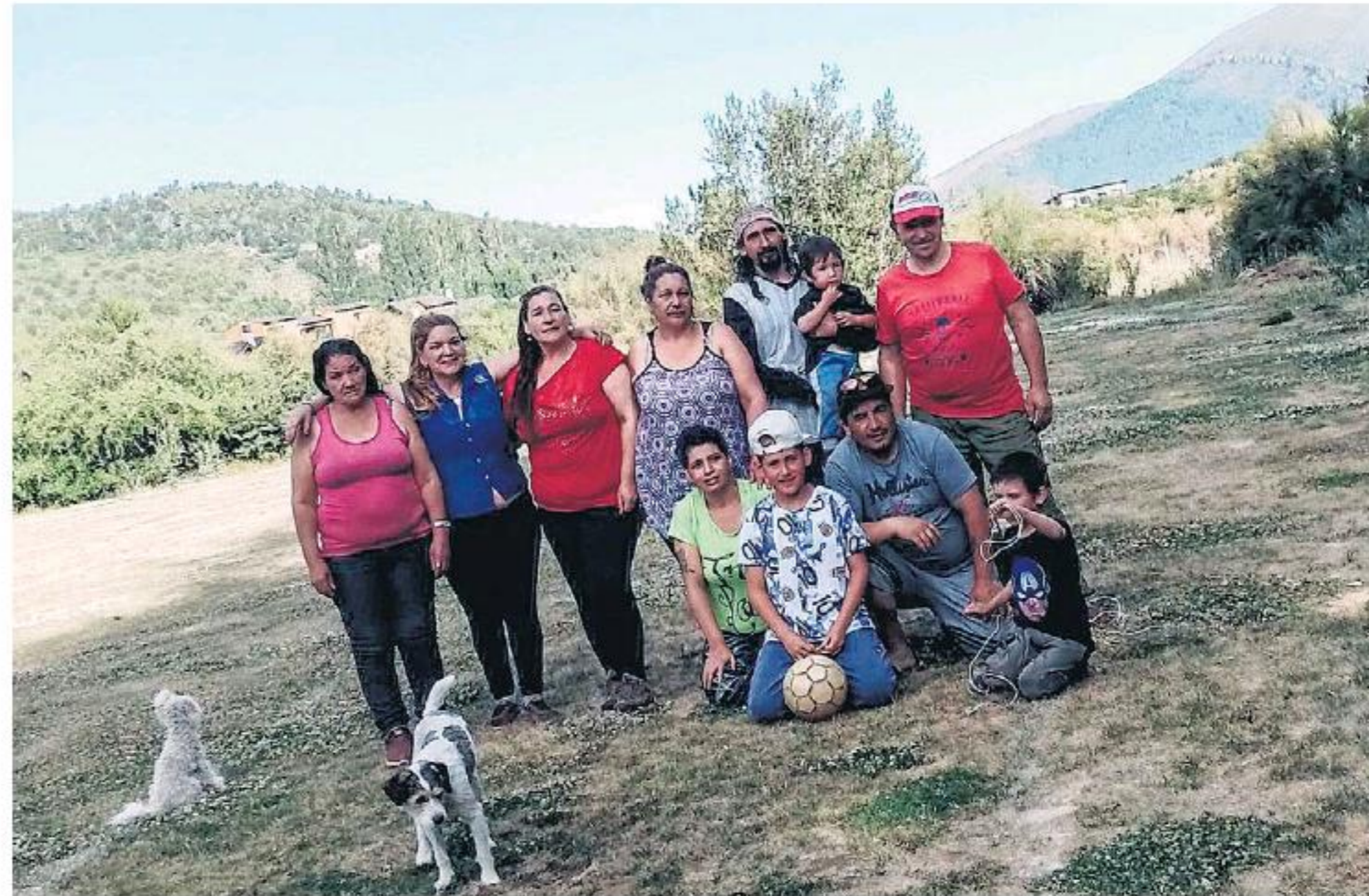
El terreno que la comunidad reclamaba como espacio de pastoreo.

El country Arelauquen ahora debe cumplir con la última parte, reconectar los servicios de agua y electricidad.