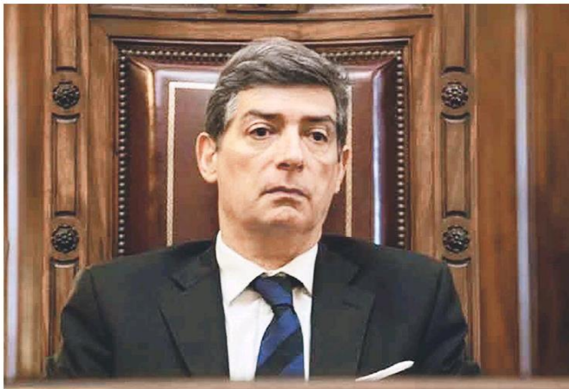
Rosatti era y es titular de la Maestría de DD.HH. de la Universidad del Litoral.