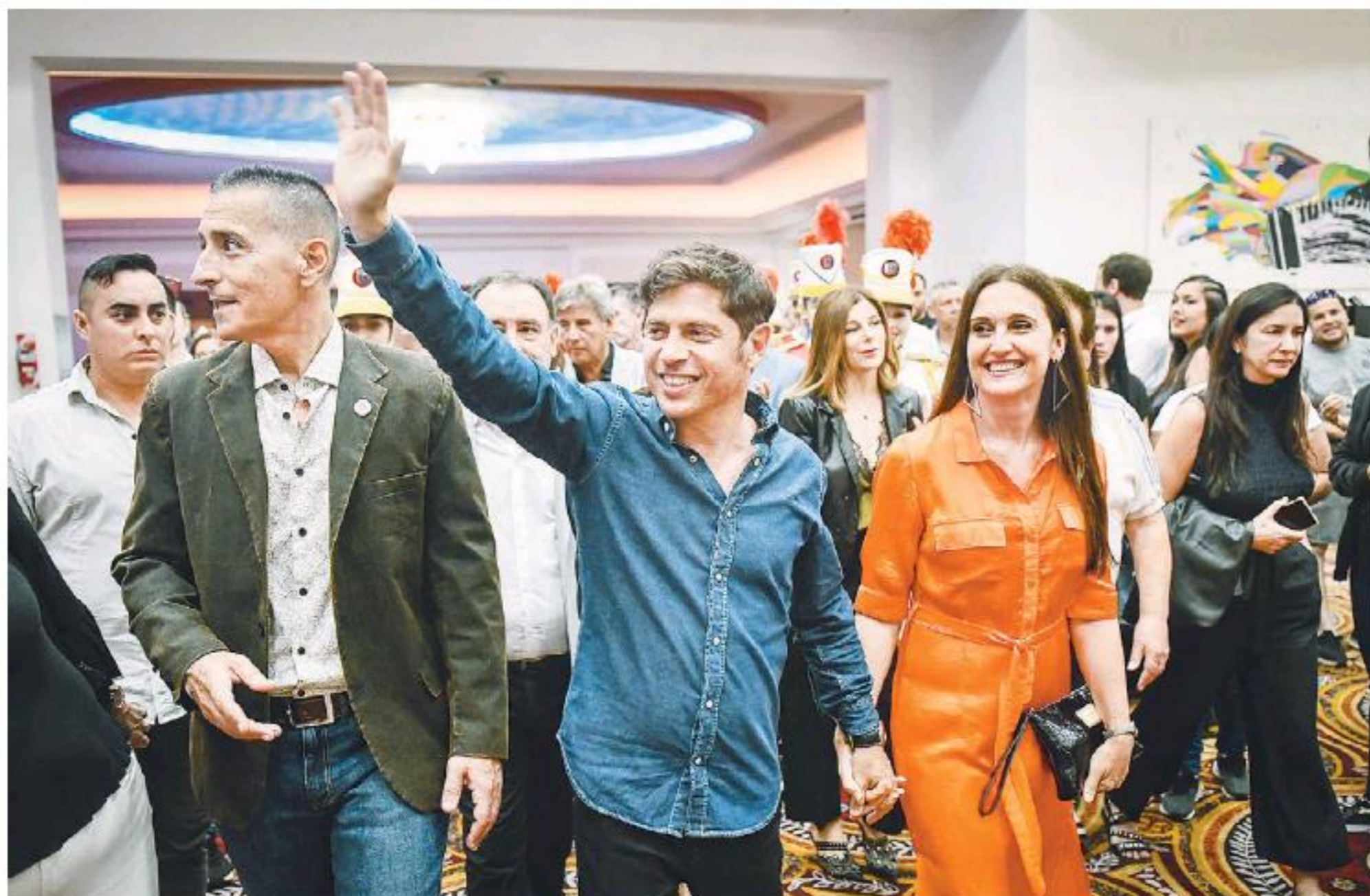
Kicillof encabezó el inicio de la temporada en el Casino de Mar del Plata.

Kicillof difundió ayer a través de sus redes un texto de 71 alcaldes bonaerenses del FdT que adhieren al juicio a los supremos.