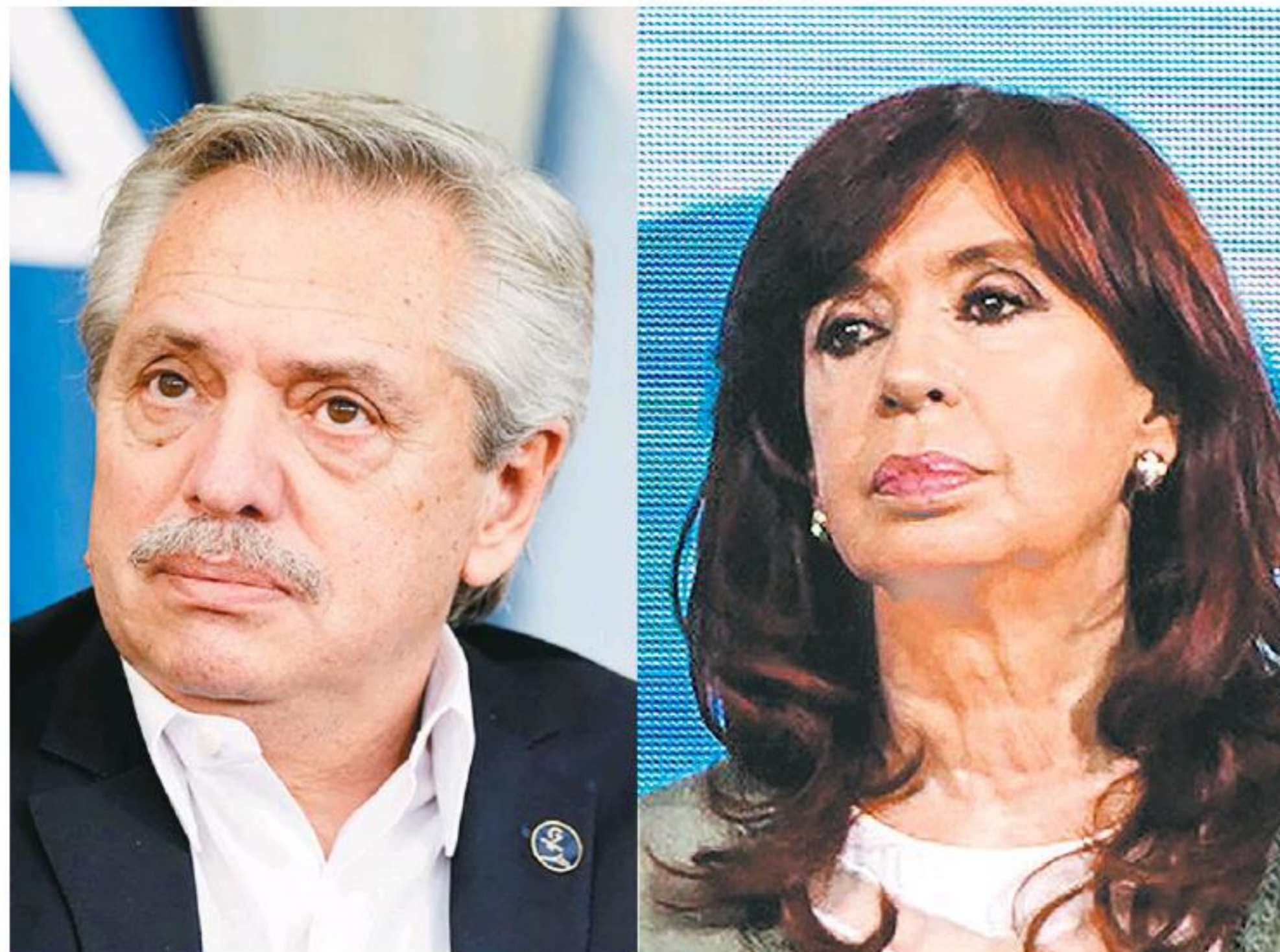
CFK llamó a reflexionar sobre el “fenómeno que jaquea las democracias”.

Además del presidente y la vice también se pronunciaron distintos ministros como el de economía, Sergio Massa, quien aseguró que repudiaba “enérgicamente” los actos de violencia y “el asalto a las instituciones democráticas en Brasil”, y el del Interior Eduardo “Wado” de Pedro. Él añadió que “el bolsonarismo no acepta las reglas de la democracia y ahora promueve un golpe de Estado”. El jefe de Gabinete, Juan Manzur, recaló “nuestra