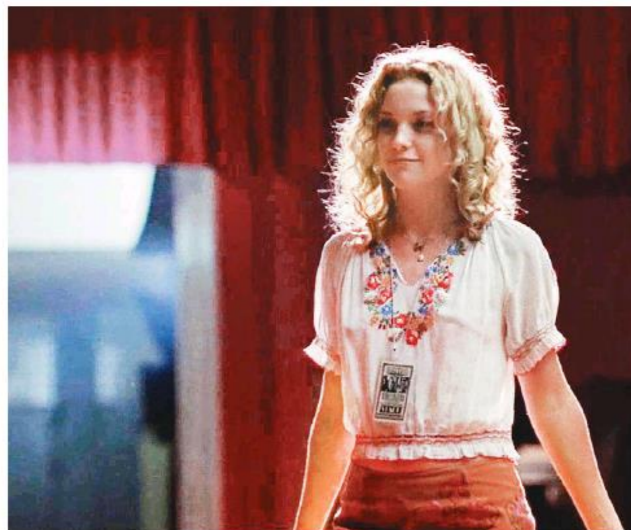
La actriz como Penny Lane en Casi famosos .

Estamos aquí para hablar de Glass Onion , la aguda y reluciente secuela de Entre navajas y se-