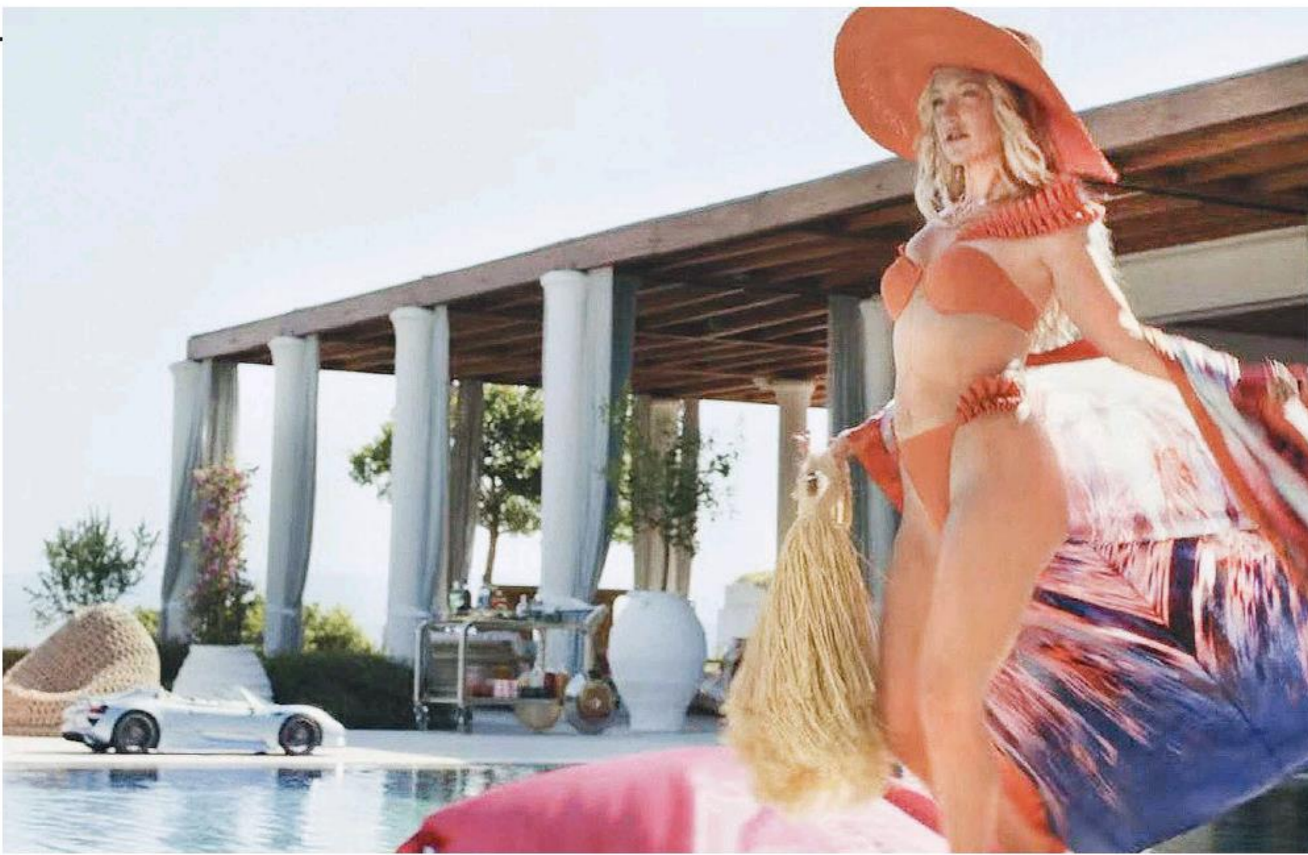
En Glass Onion , Kate Hudson encarna Birdie Jay, una exchica influyente.

queño error. Lo único que me asusta de la cultura de la cancelación es que asusta a la generación más joven. No saben si lo que están por decir puede ser recibido de manera negativa o positiva, y entonces eligen no decir nada. Creo que podemos hacer un poco de espacio para la generación más joven y que encuentren su camino.”