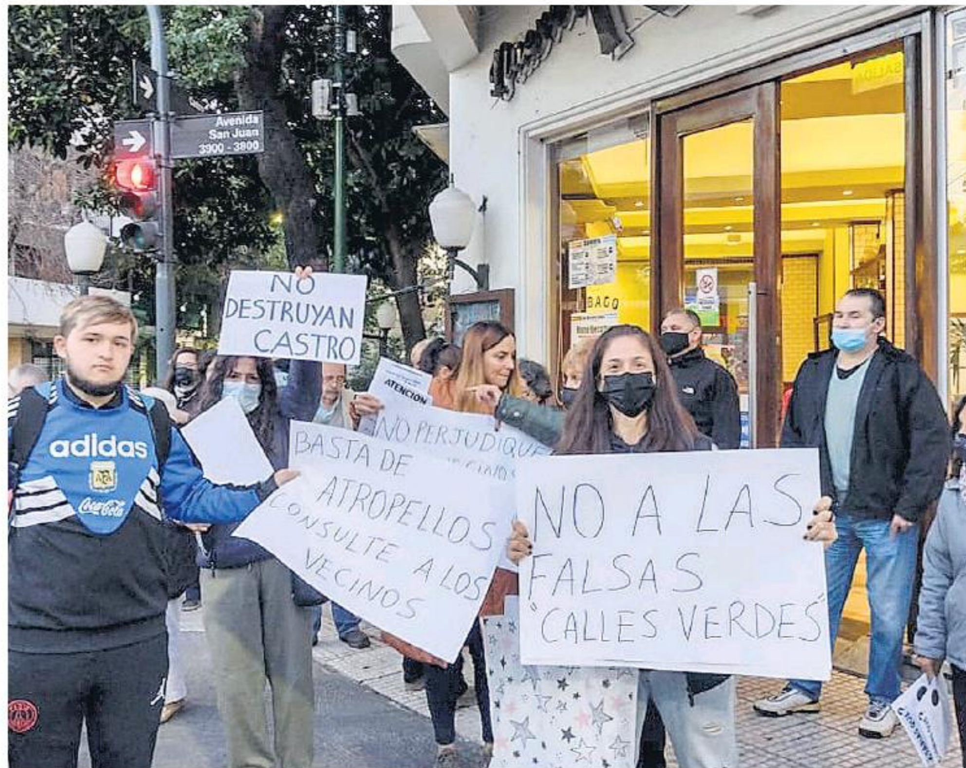
Los reclamos vecinales abrieron el terreno para que el GCBA cambie el proyecto original.

El proyecto mantendrá dos carriles para tránsito y uno para estacionamiento, como reclamaban las asociaciones vecinales.