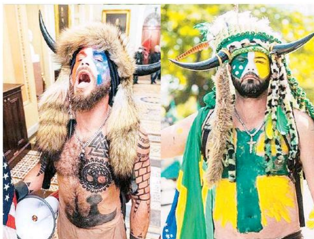
Brasil, en espejo con el Capitolio.

El mandatario de México, Andrés Manuel López Obrador, condenó el ataque y expresó su res-