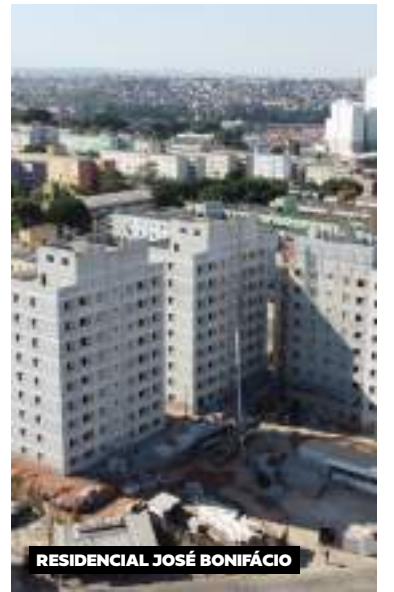
RESIDENCIAL JOSÉ BONIFÁCIO