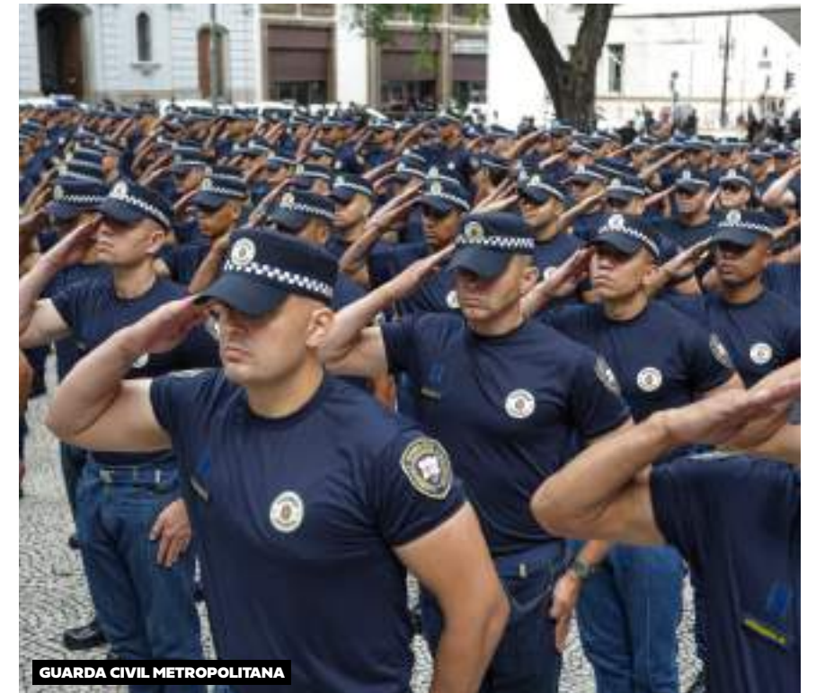
GUARDA CIVIL METROPOLITANA

Propomos um conjunto de estratégias para fortalecer a segurança e ordem urbana, com foco na prevenção e integração. Uma abordagem e uma visão ampla sobre segurança pública que visa agir na raiz do problema, reduzindo a vulnerabilidade dos jovens ao crime organizado, também, por meio da ampliação do acesso às atividades educacionais, culturais e esportivas. Além disso, continuaremos a fortalecer a Guarda Civil Metropolitana (GCM) com aumento do efetivo, modernização de equipamentos e treinamento contínuo, reorganizando a estrutura territorial do centro e garantindo mais guardas na periferia. Avançaremos na gestão integrada entre diferentes órgãos, ampliando e fortalecendo as ações em parceria com o governo estadual e a sociedade civil. Fortaleceremos as ações voltadas à proteção de nossas crianças, com o aumento da presença da GCM em horários e locais estratégicos, como escolas, fazendo a ronda escolar. Ampliaremos as ações preventivas e protetivas às mulheres, crianças e idosos vítimas de violência. A expansão do programa de videomonitoramento