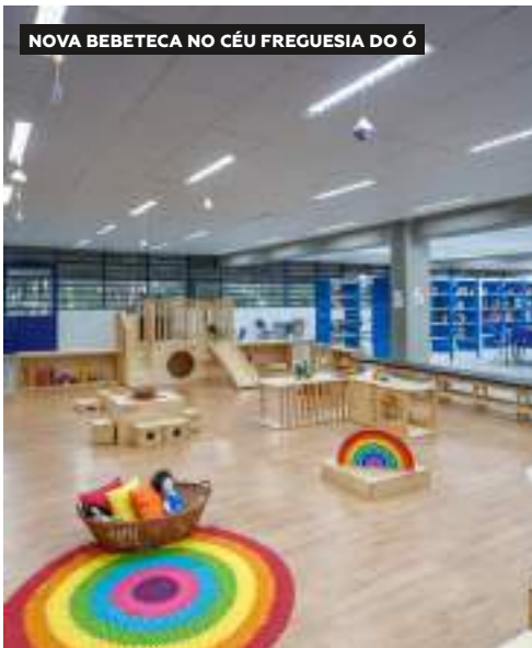
NOVA BEBETECA NO CÉU FREGUESIA DO Ó