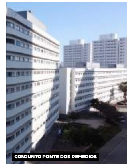
CONJUNTO PONTE DOS REMEDIOS