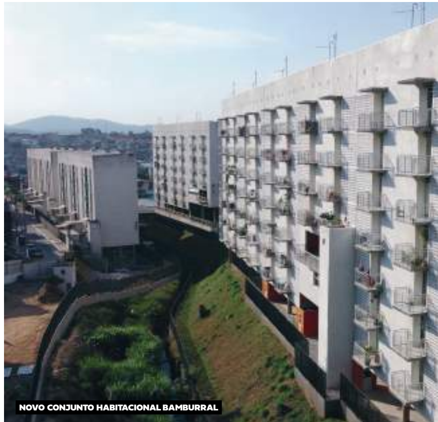
NOVO CONJUNTO HABITACIONAL BAMBURRAL

P riorizamos o acesso à moradia digna e segura com a implementação do Programa Pode Entrar, com 72 mil unidades habitacionais entregues, em obras ou contratadas. Além disso, iniciamos a primeira Parceria Público-Privada de Habitação de São Paulo, com previsão de 22 mil novas moradias. Para auxiliar a população em áreas de risco ou atingida por desastres, implementamos um novo Auxílio-Aluguel e um cartão emergencial. Criamos o programa “Pode Entrar Melhorias” para reformar moradias, com investimento de até R$ 30 mil por unidade. Ampliamos, também os recursos para Habitação de Interesse Social (HIS) para 40% dos recursos do Fundurb e 35% das Operações Urbanas, por meio da revisão do Plano Diretor. Passamos a utilizar 40% da outorga onerosa do centro para construção de unidades habitacionais. Beneficiamos 30 mil famílias com a urbanização de favelas e com as iniciativas de regularização fundiária beneficiamos 127 mil famílias. Por meio do Programa Escritura Cohab, garan-