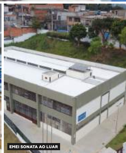
EMEI SONATA AO LUAR

Com o maior sistema de ensino municipal do país, não possuímos fila da creche pelo quarto ano consecutivo, criamos mais de 100 mil novas vagas e garantimos a vaga do bebê na rede municipal antes mesmo do nascimento. Além disso, construímos e reformamos escolas e Centros Educacionais Unificados (CEUs), equipamos salas de aula com tecnologia, ampliamos o sinal de internet de 30 mbps para 100 mbps e aumentamos o investimento em manutenção. Implementamos também programas de saúde ocular, facilitamos o transporte escolar gratuito, mudamos o modelo de compra centralizada para disponibilização de créditos às famílias dos alunos para compra de uniforme e material escolar, com maior liberdade de escolha dos itens e fortalecimento do comércio local, além da geração de empregos. Lançamos um aplicativo de segurança para escolas e intensificamos a busca ativa por alunos faltosos. Avançamos no ensino integral e técnico, valorizamos os professores com aumento salarial e benefícios, instituímos a Gratificação de Local de Trabalho (GLT) para fixar professores em escolas com maior rotatividade, e nomeamos mais de 15 mil novos servidores para suprir necessidades